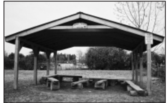
Edmison Heights Public School

L'abri est très populaire auprès des élèves, en particulier ceux qui ne désirent pas faire de sport ou s'amuser dans les structures de jeu. À l'automne et au printemps, les élèves profitent de la récréation pour aller dans l'abri et discuter, jouer, dessiner ou même faire des devoirs. L'abri est également un lieu de rassemblement pour les classes qui utilisent l'aire naturelle adjacente. Ainsi, les professeurs ont un meilleur contrôle sur leur classe et les élèves écoutent avec plus d'attention.