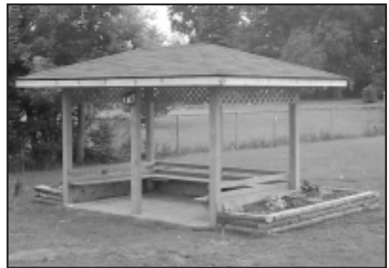
Toniata Public School