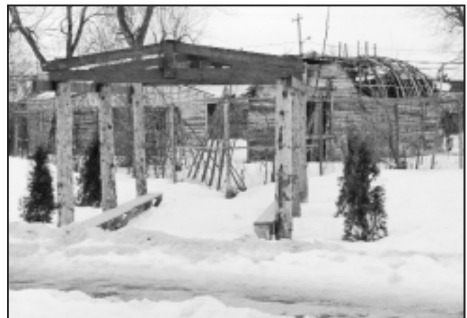
Kahronianhonha Mohawk Immersion School

L'arboretum ressemble à une cabane traditionnelle, l'habitation typique du peuple Iroquois. En lien avec la tradition, le bâtiment qui mesure trois mètres par six mètres (10 pieds par 20 pieds) possède une ouverture du côté est pour admirer le lever du soleil à chaque jour. À l'intérieur, il y a des bancs pour permettre aux élèves de suivre les cours à l'extérieur ou de réfléchir tout simplement. Six cèdres ont été plantés autour du périmètre du bâtiment. Le cèdre est l'arbre traditionnel des Iroquois et on lui attribue un effet apaisant. Les membres de la communauté scolaire ont planté des ipomées de Horsfall, ou gloires du matin, et des plantes grimpantes sauvages pour couvrir la structure et faire de l'ombre durant les mois les plus chauds.