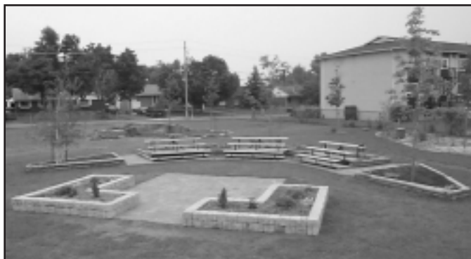
Toniata Public School

Les amphithéâtres peuvent être construits de façon traditionnelle en utilisant des bancs de bois ou de façon créative en aménageant des collines de gazon dans un endroit circulaire ou semi-circulaire où les élèves peuvent se rassembler et s'asseoir.