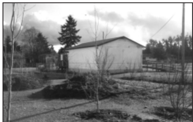
K.B. Woodward Elementary School — APRÈS