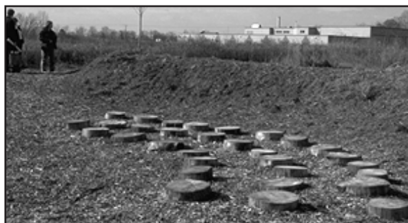
Our Lady of Mount Carmel