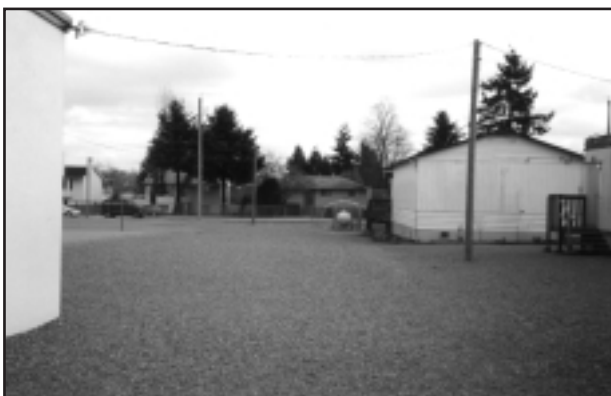
K.B. Woodward Elementary School — AVANT

Le centre culturel de la nation Sto:lo a été consulté pour faciliter l'aménagement du lieu de rassemblement. De plus, les employés de l'école K.B. Woodward ont visité le jardin ethnobotanique didactique du centre culturel. Les plans finaux comprenaient trois maisons semi-souterraines additionnelles enfouies dans le sol en petit cercle et recouvertes de gazon de placage pour créer une colline naturelle dans le paysage. Les feux de camps typiques des maisons semi-souterraines sont représentés par des roches de granite noir placées au centre de chaque maison. Finalement, on a placé des billots de bois et des roches autour des maisons pour permettre aux gens de s'asseoir.