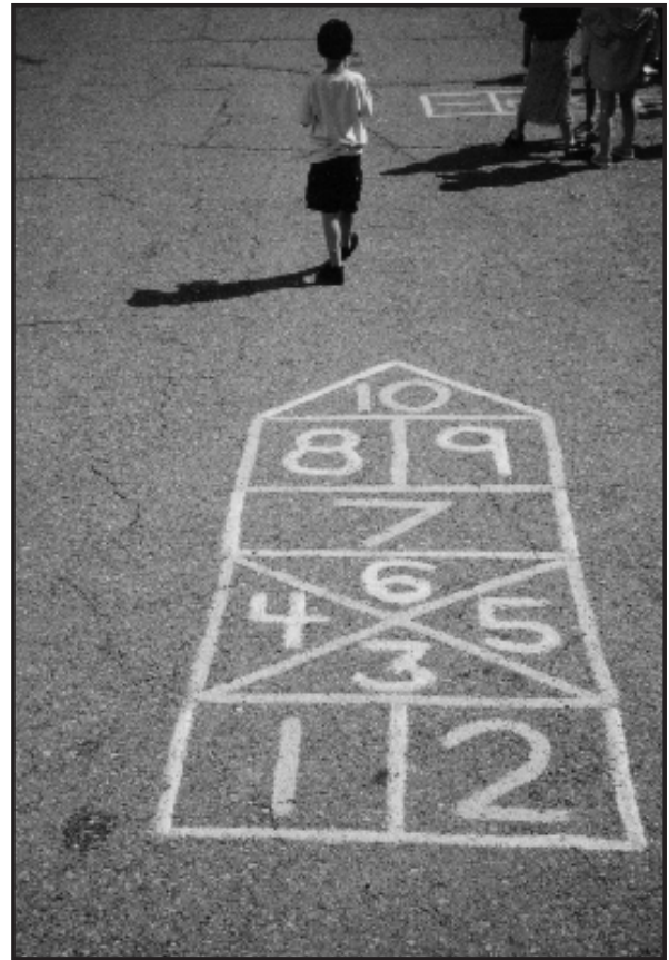
St. Stephen's Elementary School

La peinture nous a été donnée par des entreprises de la région qui se sont départies des pots de peinture inutilisés et des restes. Nous avons choisi la peinture au latex puisqu'elle n'est pas toxique et qu'elle se nettoie facilement. La grande partie du travail a été faite par des parents bénévoles, mais quelques élèves plus âgés ont également aidé à peindre les jeux. La première couche de peinture a été donnée en juin 2000 et les peintures d'asphalte sont encore, à ce jour, aussi belles qu'à l'origine.