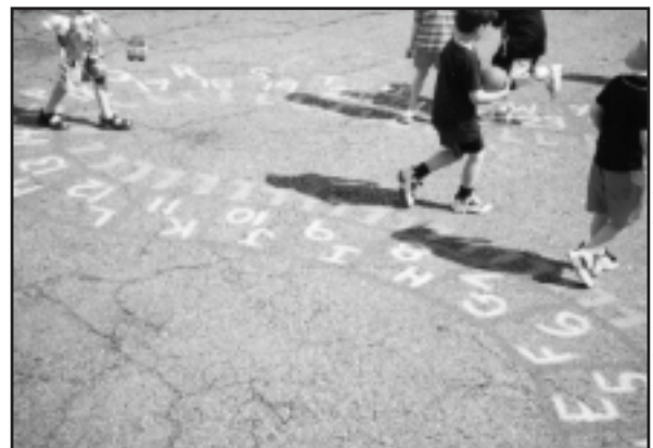
St. Stephen's Elementary School